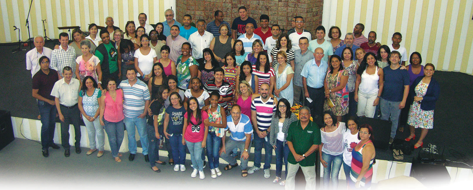
PARTICIPANTES do Curso EBD Viva, realizado na Igreja Batista do Moneró, na Ilha do Governador, Rio de Janeiro