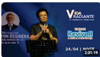
Noite de Quarta | 21º Congresso Vida Radiante | 24/04/24